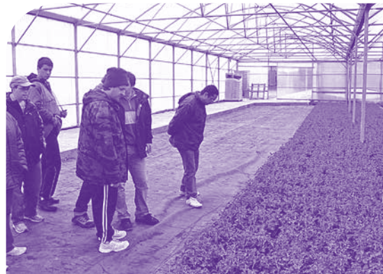
En visite à la pépinière CARTE