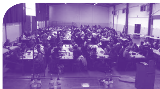
les 270 participants

270 personnes ont participé en 2013 au loto de l'adapei 31, un petit peu moins qu'en 2012. Il faut dire qu'il y avait ce jour-là de la concurrence avec d'autres manifestations qui pouvaient intéresser les familles. Même si on en espérait davantage, il a cependant rapporté près de 5 900 euros que l'association va pouvoir utiliser pour soutenir les activités du Club Alouette et de l'ASL31. Un grand merci à tous nos sponsors et aux participants. ■