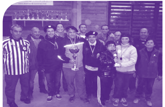
Une belle saison de pétanque