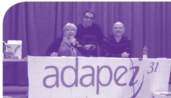
Un grand merci aux animateurs

270 personnes ont participé en 2013 au loto de l'adapei 31, un petit peu moins qu'en 2012. Il faut dire qu'il y avait ce jour-là de la concurrence avec d'autres manifestations qui pouvaient intéresser les familles. Même si on en espérait davantage, il a cependant rapporté près de 5 900 euros que l'association va pouvoir utiliser pour soutenir les activités du Club Alouette et de l'ASL31. Un grand merci à tous nos sponsors et aux participants. ■