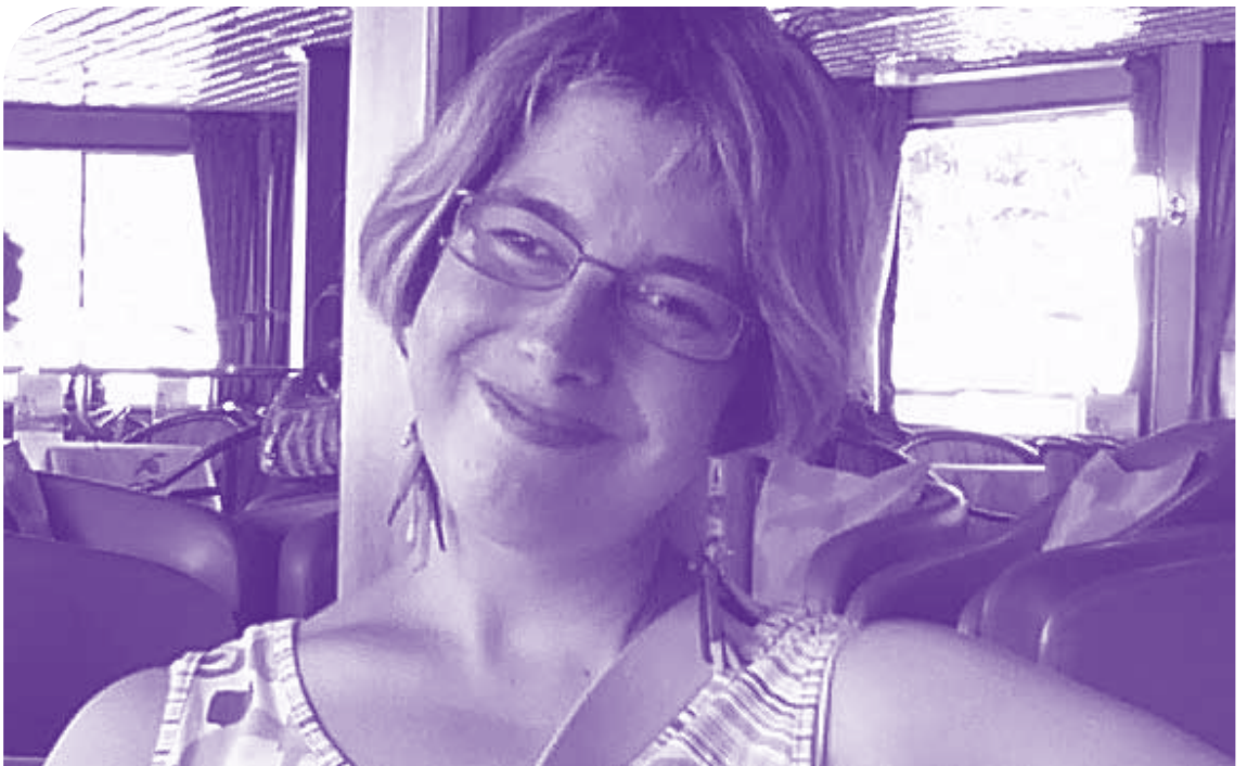
Faustine © adapei 31