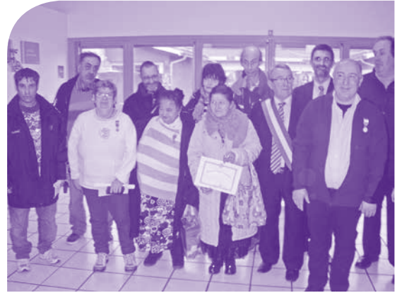
Le sourire des médaillés