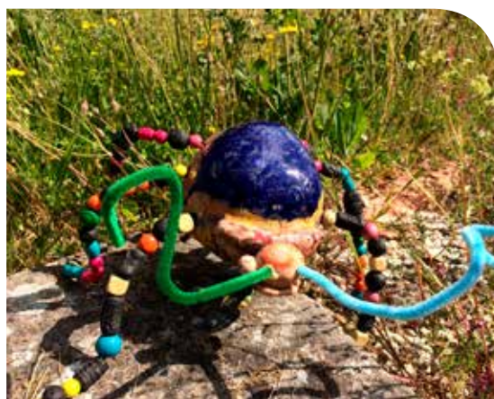
Une oeuvre issue de l'atelier