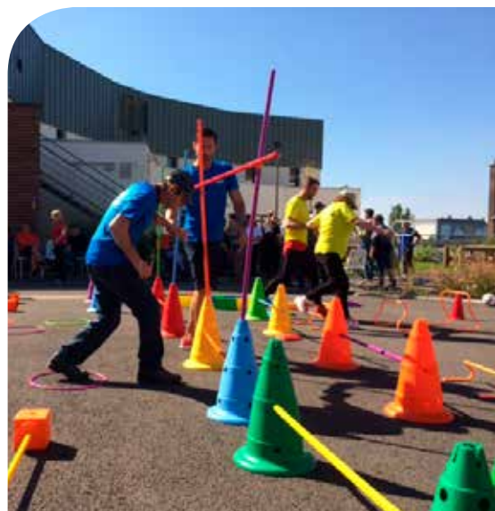
Activités olympiques

Jeudi 5 octobre 2017 : Le sport a fait sa rentrée au Foyer Pierre Ribet. En effet, par une journée ensoleillée, les résidents et les salariés se sont affrontés lors des Olympiades organisées pour la première fois au sein de l'établissement. C'est dans une grande compétition que les différents challenges ont été réalisés. Avec ambiance festive et une envie de gagner, toutes les équipes se sont affrontées partageant un bon esprit et une belle solidarité.