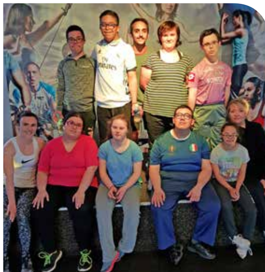
Après l'effort, la photo

Des mercredis très sportifs pour nos jeunes qui semblent fort apprécier ces activités de détente. L'accompagnement en milieu extérieur est essentiel pour acquérir des bases qui permettront aux jeunes adultes de s'insérer au mieux dans la société ■