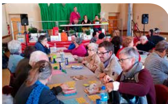
Quinté 1

C'est de nouveau à la salle polyvalente Louis Médaillon à Auch qu'a eu lieu notre traditionnel loto le 19 novembre. Toujours beaucoup de lots, de joie pour les gagnants, un peu de déception pour les autres, mais l'assurance pour tous d'une après-midi ludique et conviviale. Un grand merci aux participants ainsi qu'aux familles, commerçants et fournisseurs de l'Agapei qui ont donné de nombreux lots et bien sûr aux bénévoles, indispensables à l'organisation de cette manifestation ■