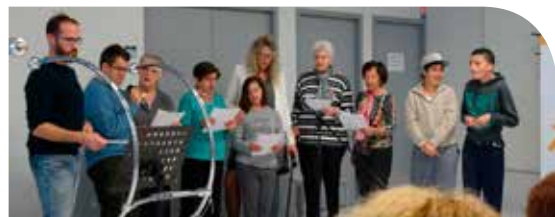
Concert de BAO PAO

Le 9 novembre 2017 a eu lieu le vernissage de l'exposition "Familles en Harmonie" organisée par UNI-Cité.