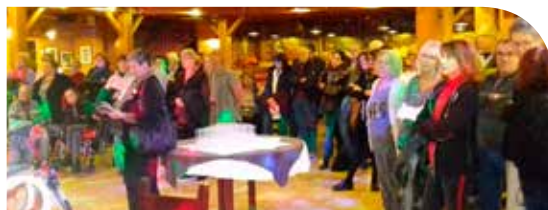
Soirée de clôture

Les excellents résultats ont pu être atteints grâce à la mobilisation d'environ 150 bénévoles, parmi lesquels beaucoup d'adhérents et amis, et bon nombre de résidents de nos établissements, que ce soit de la Résidence Pierre Ribet, du Foyer de Vie la Demeure ou des établissements du Comminges, accompagnés chaque fois par des salariés de l'Agapei dévoués à notre cause. Que tous soient remerciés pour leur aide !