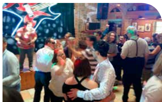
On scélète sur la piste

150 Personnes se sont réunies en ce dimanche 15 octobre au chalet des moissons à Balma. Un accueil chaleureux. Un repas unanimement apprécié et une piste de danse prise d'assaut par les jeunes - et moins jeunes - pour des déhanchements endiablés sous la houlette musicale d'un DJ fort sympathique. Nous n'avions jamais atteint un tel chiffre de participation mais nous ne doutons pas de le dépasser largement l'année prochaine.